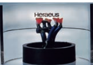
Posicionador para pieza fundida