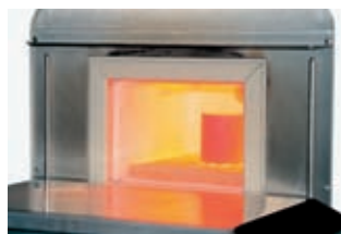
Aleaciones cerámicas de 850-950°C