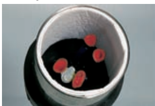
Molde con anillo de acero y recubrimiento anular